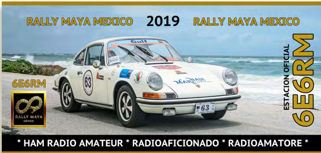
Promoción en Redes Sociales e Impreso en la Taza Conmemorativa