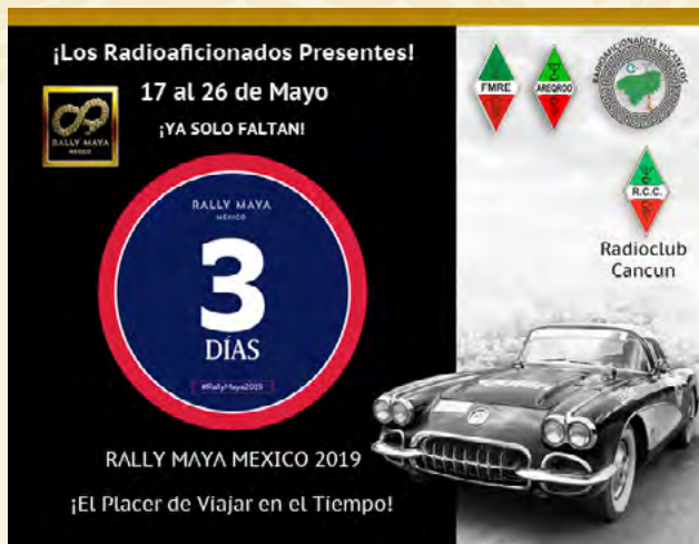
Este gráfico es parte de la serie de gráficos subidos a las redes sociales, como Facebook y Twitter