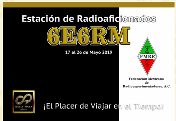
Lona Impresa para instalar en la Estación