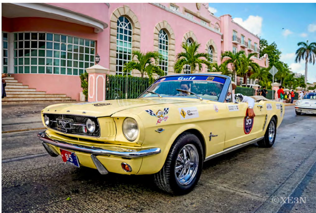
Salida de la Ciudad de Mérida rumbo a la Ciudad de Motúl, conocida mundialmente por dar origen al exquisito platillo “Huevos Motuleños”