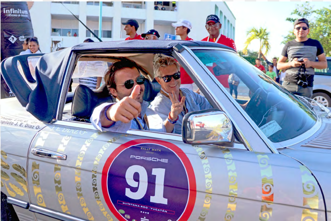
Felicidad total por llegar a la Meta, ¡ Misión Cumplida !