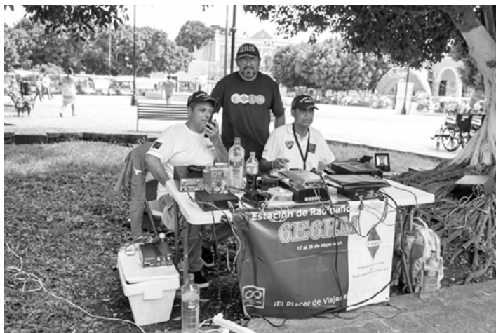
Gran Equipo entre AREQROO y Radio Aficionados Yucatecos